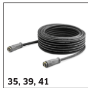
35, 39, 41